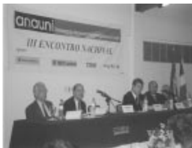
III Encontro Nacional da Anauni realizado em Salvador (BA), em outubro e novembro de 2002

Na segunda metade de 2001, por requerimento formulado pela Associação, foi reconhecido aos Advogados da União, no âmbito administrativo, o direito de receber aumento do valor da Gratificação de Desempenho de Atividade Jurídica (GDAJ), independentemente de compensação com a Vantagem Pessoal Nominalmente Identificada (VPNI).