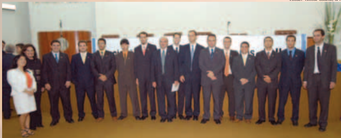
Os membros da nova diretoria tomaram posse no dia primeiro de março de 2005

Vale lembrar que a ANAUNI vem, há tempos, lutando pela remuneração por subsídio porque entende que se trata não apenas de atender a um comando constitucional explícito, o que já seria razão mais que suficiente, mas de sanar as distorções salariais há muito