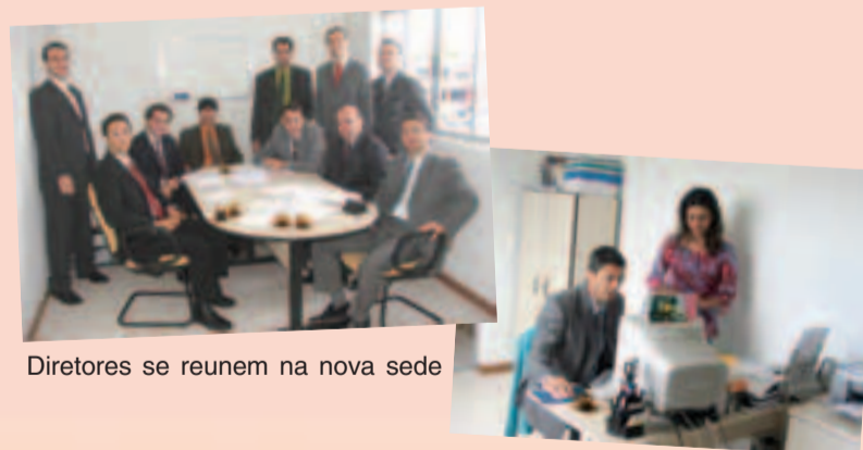
Diretores se reúnem na nova sede

A Associação Nacional dos Advogados da União está funcionando em novo endereço em Brasília. Além de estar situado bastante próximo à sede da AGU, o local oferece mais espaço para desenvolvimento das atividades da Associação, realização de reuniões da Diretoria e para atendimento aos associados.