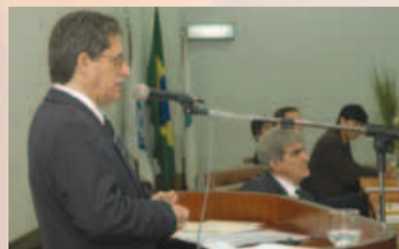
Ministro Álvaro Ribeiro parabeniza a nova gestão