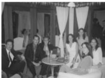
Advogados da União reunidos durante o coquetel de abertura do Encontro, no Hotel Catussaba