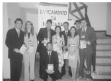
Lançamento da Revista Jurídica da Anauni "Debates em Direito Público"

Além dessa, deverão ser propostas outras ações a respeito da majoração dos valores de auxílio-alimentação; sobre o recebimento de honorários de sucumbência em favor do Advogado da União; bem como de DAS por parte de substituto de chefia a partir do primeiro dia de substituição e recebimento de anuênios por parte dos ex-celetistas provenientes de empresas públicas e sociedades de economia mista.